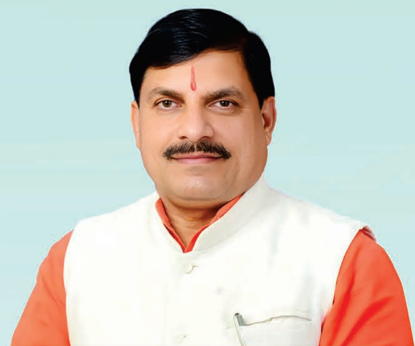
डॉ. मोहन यादव, मुख्यमंत्री

21 नवम्बर, 2024 | अपराह्न 2:00 बजे सामाजिक न्याय परिसर उज्जैन, मध्यप्रदेश