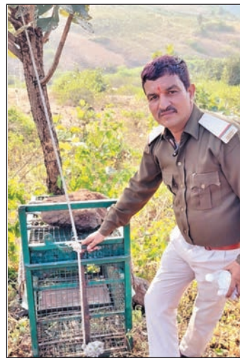
विभाग के अधिकारियों ने माँके पर पहुंच

विभाग के अधिकारियों ने माँके पर पहुंच कर शावक को अपने साथ ले गए। चिकित्सकों ने स्वास्थ्य परीक्षण किया। बुधवार रात में उसे कमरे में रखकर पशु बच्चा पूरी तरह स्वस्थ पाया गया।