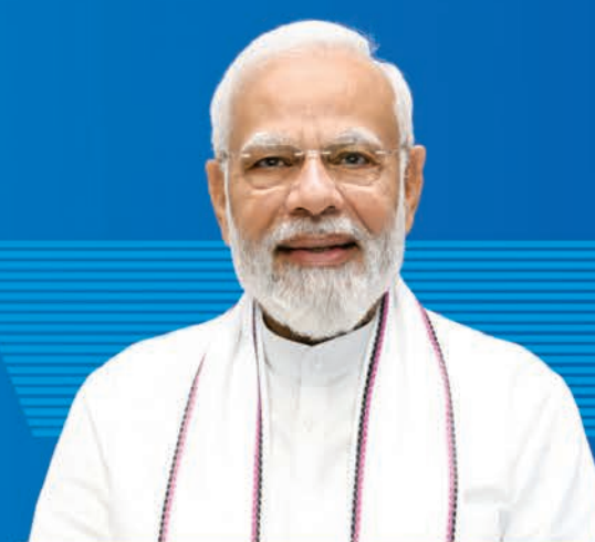
नरेन्द्र मोदी, प्रधानमंत्री