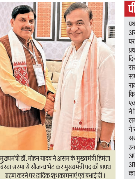
मुख्यमंत्री डॉ. मोहन यादव ने असम के मुख्यमंत्री हिमंता बिस्वा सरमा से सौजन्य भेंट कर मुख्यमंत्री पद की शपथ ग्रहण करने पर हार्दिक शुभकामनाएं एवं बधाई दी।

उल्लेखनीय है कि असम विधानसभा चुनाव 2026 में राज ने शानदार प्रदर्शन करते हुए 126 सदस्यीय विधानसभा में 102 सीटों पर जीत हासिल की। इसमें भाजपा को 82 सीटें मिलीं, जबकि सहयोगी दलों अगप को 10 तथा बीपीएफ को 10 सीटों पर जीत हासिल करने में सफलता हासिल की।