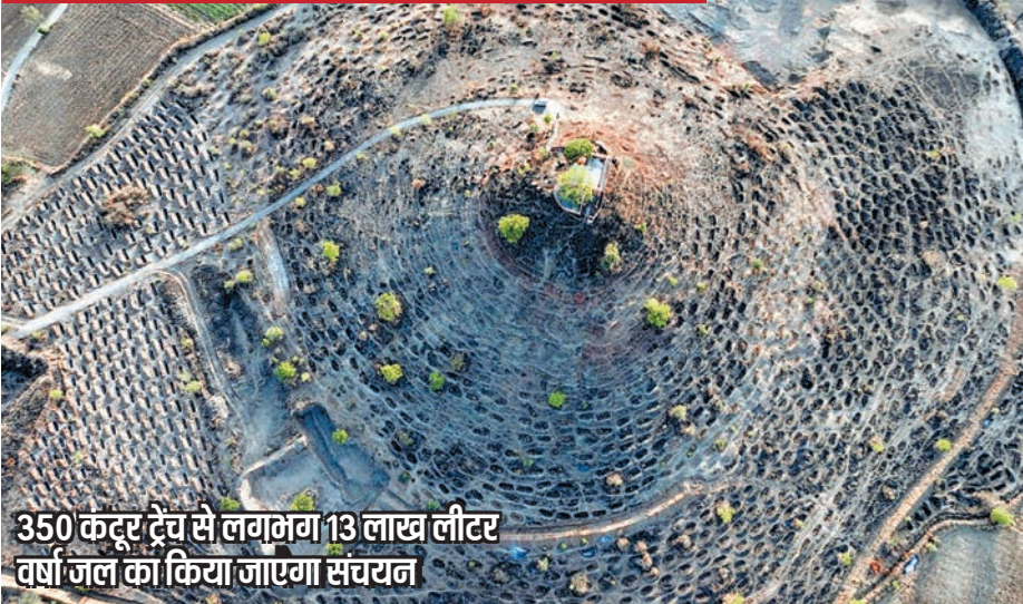
350 कंटर ट्रेच से लगभग 13 लाख लीटर वर्षा जल का किया जाएगा संचयन