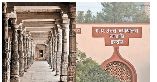
स्वरूप और अधिकार किसके पास रहेंगे। मुस्लिम पक्ष की दलीलें-

अब सभी की निगाहें उच्च न्यायालय के अंतिम निर्णय पर टिकी हैं, जो यह तय करेगा कि इस ऐतिहासिक परिसर का धार्मिक