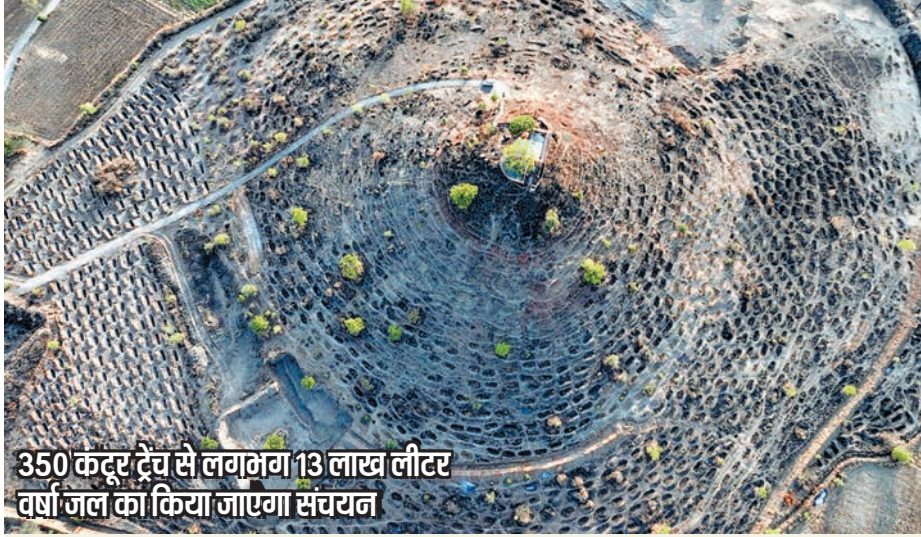
350 कट्टर ट्रेच से लगभग 13 लाख लीटर वर्षा जल का किया जाएगा संचयन