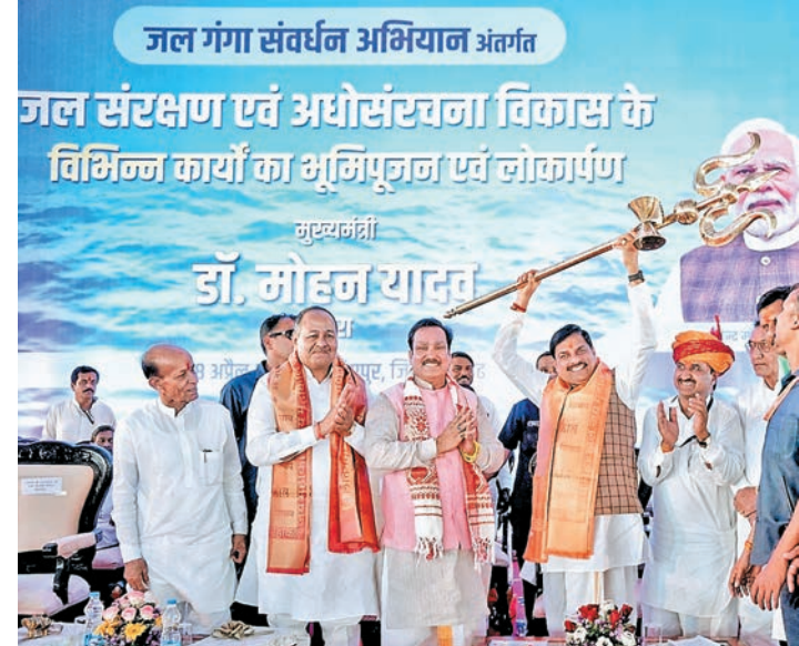
जल गंगा संवर्धन अभियान अंतर्गत जल संरक्षण एवं अधोसंरचना विकास के विभिन्न कार्यों का भूमिपूजन एवं लोकार्पण मुख्यमंत्री डॉ. मोहन यादव

जो राज्य की ग्रामीण अर्थव्यवस्था और पर्यावरणीय संतुलन के लिए एक सुखद संकेत है। पंचायत एवं ग्रामीण विकास विभाग द्वारा महात्मा गांधी नरंगा (भनरंगा) के समन्वय से संचालित इस विशाल अभियान के लिए राज्य सरकार ने व्यापक वित्तीय प्रावधान किए हैं। पूरे प्रदेश में कुल 2 लाख 42 हजार 188 कार्यों का लक्ष्य निर्धारित किया गया है, जिसके लिए 6,201.81 करोड़ रुपये की राशि स्वीकृत की गई है। इस महात्वाकांक्षी योजना के क्रियान्वयन में अब तक 4,443.85 करोड़ रुपये का व्यय किया जा चुका है। अभियान का मुख्य उद्देश्य 'खेत का पानी खेत में और गांव का पानी गांव में' रोकने की अवधारणा पर है।