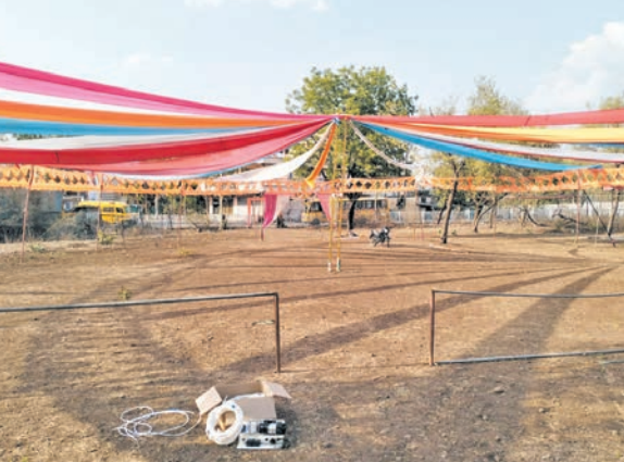
एक माह से चल रही तैयारियां पूर्ण