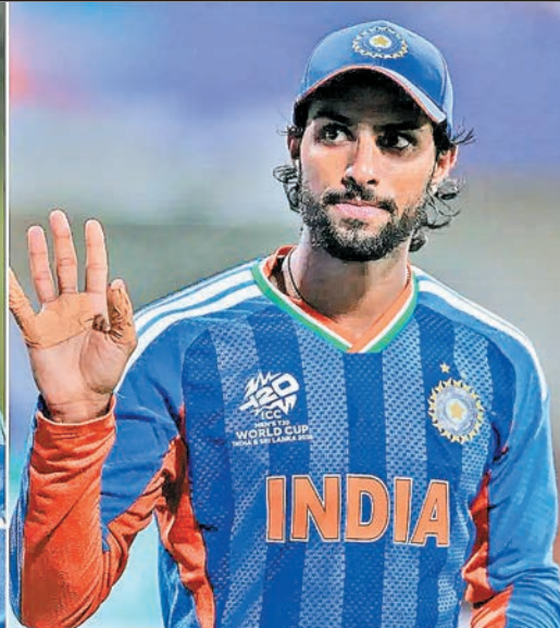
सीरीज का कार्यक्रम... भारत, श्रीलंका और अफगानिस्तान ए के बीच होने वाली ये त्रिकोणीय सीरीज आईपीएल 2026 के बाद खेले जाएगी। इसका पहला मुकाबला नौ जून को भारत और श्रीलंका की ए टीमों के बीच खेला जाएगा, जबकि भारत का दूसरा मुकाबला 11 जून को अफगानिस्तान से होगा। तीनों ही टीमों कुल चार-चार मुकाबले खेलेंगी और जो दो टीमों सबसे ज्यादा मैच जीतीगी उनके बीच 21 जून को त्रिकोणीय सीरीज का फाइनल मैच खेला जाएगा।