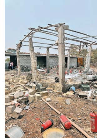
जांच के आदेश और आर्थिक सहायता की घोषणा