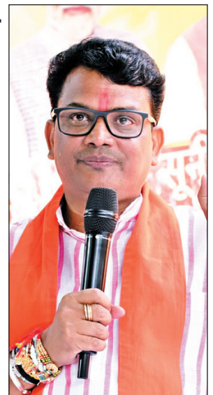
पदाधिकारीगण, कार्यकर्ताओं द्वारा सराहनीय कदम बताया गया।