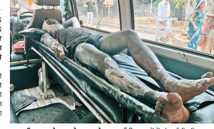
गंभीर रूप से झुलसे मजदूरों को इंदौर रेफर किया