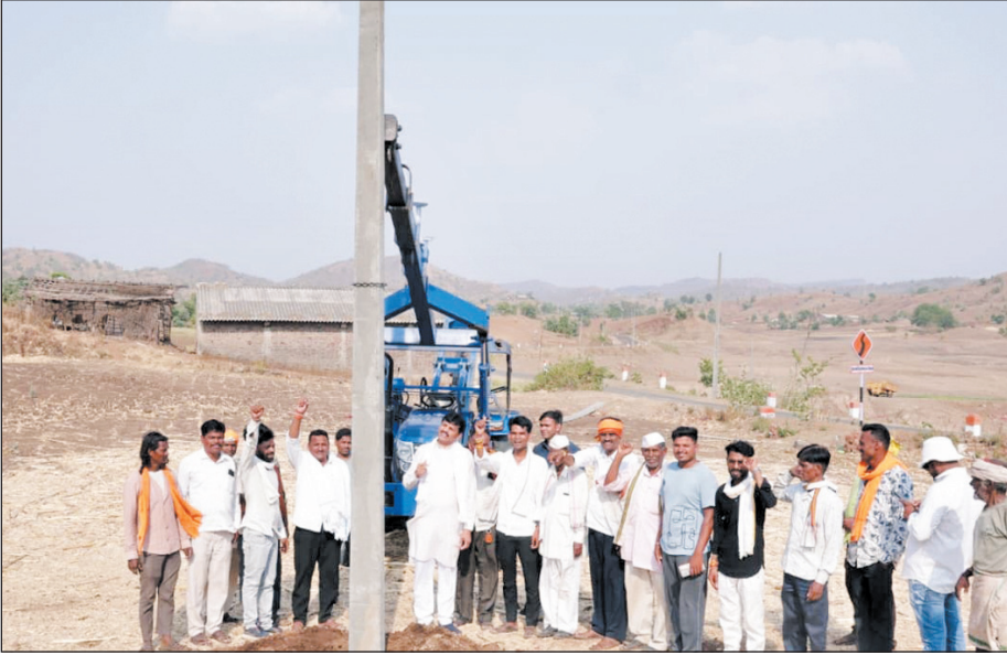
मार्गदर्शन एवं प्रदेश के मुख्यमंत्री विकास की मुख्यधारा से जोड़ा जा रहा है। क्षेत्र में स्कूल भवन, आंगनबाड़ी भवन, पंचायत भवन, पुल-पुलिया एवं विद्युत

वर्षों से पिछड़े माने जाने वाले ग्रामीण क्षेत्रों को आज देश के यशस्वी प्रधानमंत्री नरेंद्र मोदी के