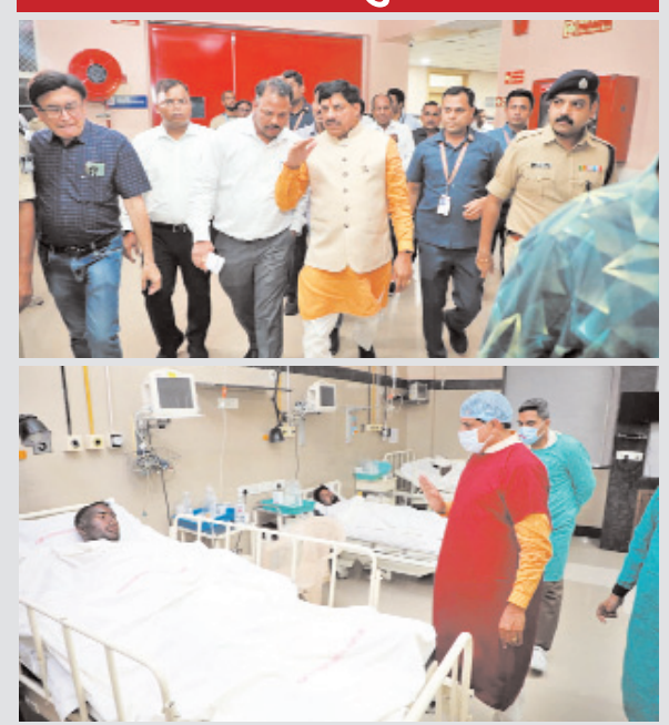
इंदौर । मुख्यमंत्री डॉ. मोहन यादव देर शाम चोईथराम हॉस्पिटल पहुंचे। उन्होंने यहां देवास में हुई घटना में प्रभावितों से मिले और उनके स्वास्थ्य संबंधी जानकारी ली।