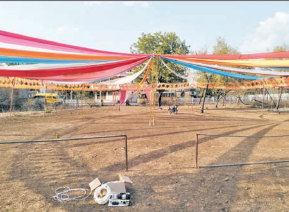
एक माह से चल रही तैयारियां पूर्ण