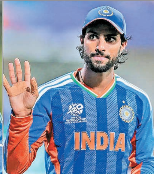
सीरीज का कार्यक्रम... भारत, श्रीलंका और अफगानिस्तान ए के बीच होने वाली ये त्रिकोणीय सीरीज आईपीएल 2026 के बाद खेले जाएगी। इसका पहला मुकाबला नौ जून को भारत और श्रीलंका की ए टीमों के बीच खेला जाएगा, जबकि भारत का दूसरा मुकाबला 11 जून को अफगानिस्तान से होगा। तीनों ही टीमों कुल चार-चार मुकाबले खेलेगी और जो दो टीमों सबसे ज्यादा मैच जीतीगी उनके बीच 21 जून को त्रिकोणीय सीरीज का फाइनल मैच खेला जाएगा।