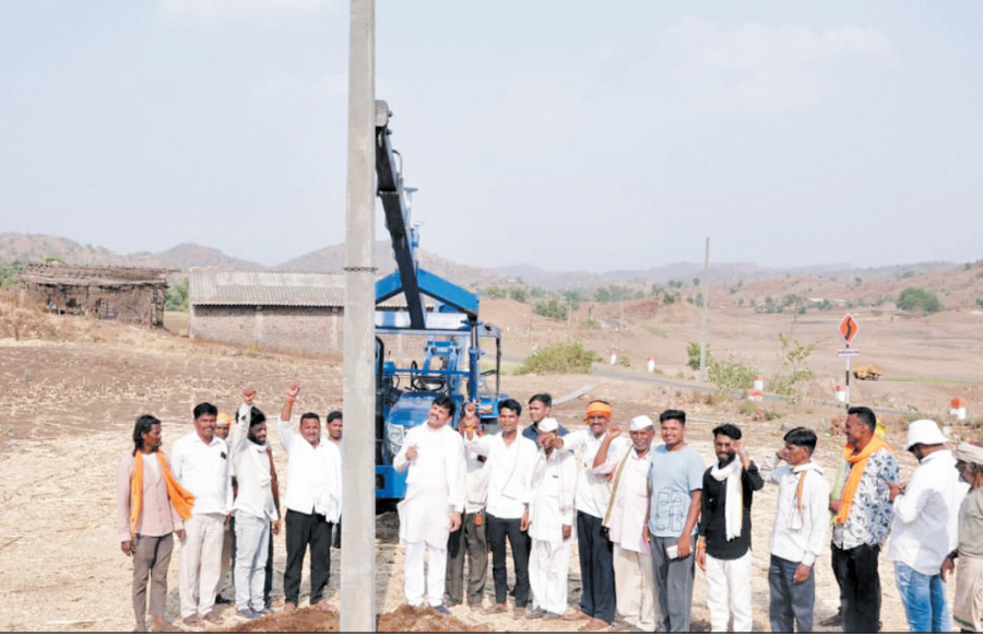
मार्गदर्शन एवं प्रदेश के मुख्यमंत्री विकास की मुख्यधारा से जोड़ा जा रहा है। क्षेत्र में स्कूल भवन, आंगनबाड़ी भवन, पंचायत भवन, पुल-पुलिया एवं विद्युत

वर्षों से पिछड़े माने जाने वाले ग्रामीण क्षेत्रों को आज देश के यशस्वी प्रधानमंत्री नरेंद्र मोदी के