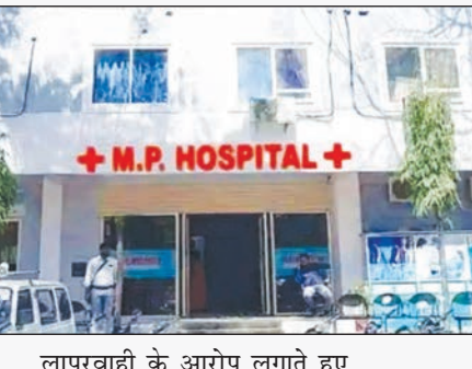
लापरवाही के आरोप लगाते हुए

उज्जैन, निप्र। एमपी अस्पताल का लाइसेंस स्वास्थ्य विभाग ने निरस्त कर दिया है। 21 अप्रैल की रात इंदौर रोड स्थित महामृत्युंजय द्वार के पास हुए सड़क हादसे में घायल युवक की इलाज के दौरान मौत हो गई थी। घटना के बाद परिजनों ने अस्पताल प्रबंधन पर इलाज में